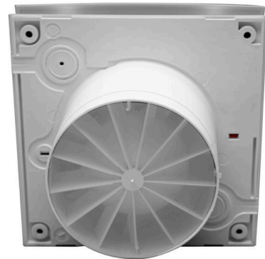
Compuerta anti retorno